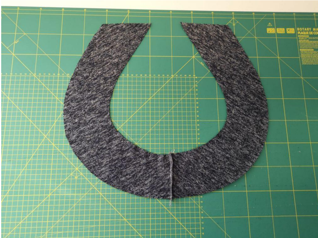
14. Šev sešijeme