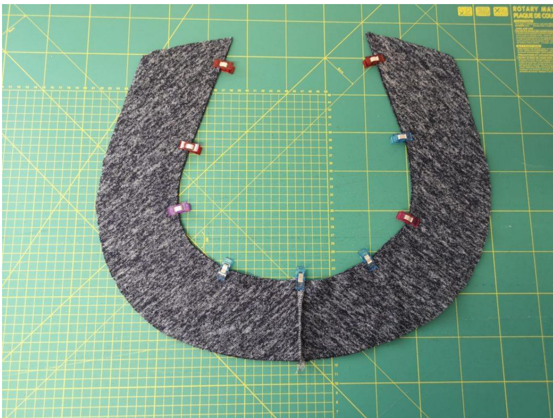
15. Obě připravené části věčkového výstřihu položíme LS na LS na sebe a sešpendlíme dle fotky.