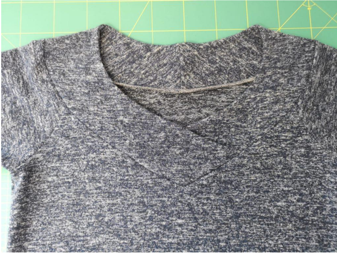
25. Všíť vėčkový límec.