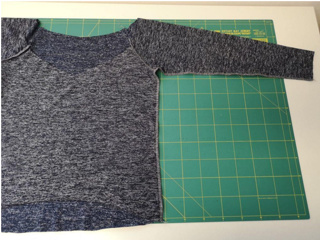
8. Šev sešijeme